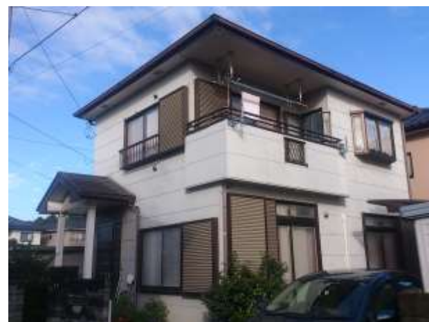
外 観 写 真